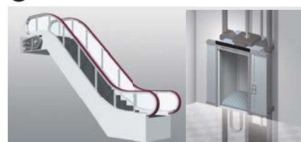
6 K8AK-PH Escaleras/Ascensores