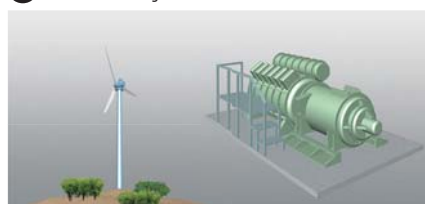
7 K8AK-PW Aerogeneradores