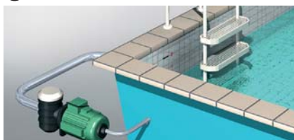
2 K8AK-AW Control de nivel