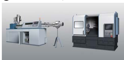
5 K8DS-PH Extrusoras/Máquina herramienta