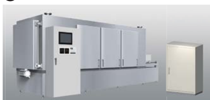
4 K8AK-VW Cuadros de control